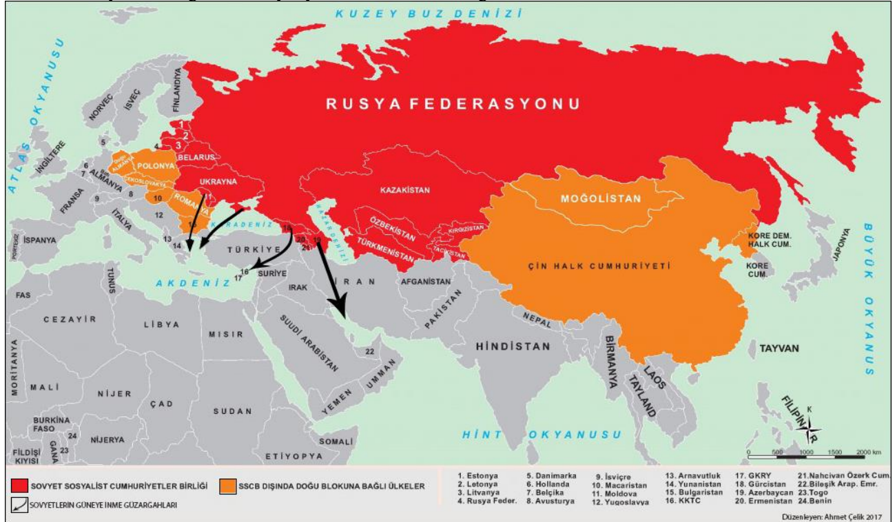
Harita 1. Sovyetler Birliği'nin Güney Siyaseti Muhtemel Güzergâhları

Sovyetler, daha Dünya Savaşı'nın dumanları tüterken harekete geçmişti. Türkiye, Yunanistan ve İran O'nun baskısını ilk hissedenlerdi. Sovyetlerin Doğu Avrupa'daki davranışları, savunma bakımından açıklanabilirse